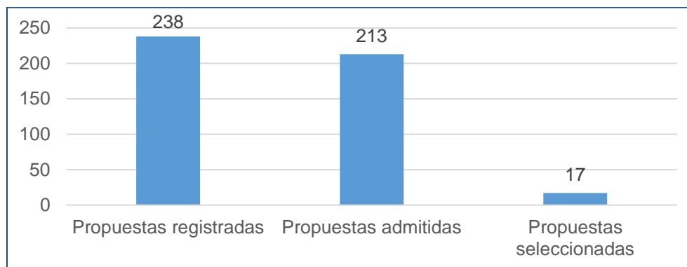
Gráfica N° 01: Propuestas registradas, admitidas y seleccionadas en la prioridad seguridad ciudadana

En la prioridad seguridad ciudadana se registraron 238 propuestas, fueron admitidas 213 1 y seleccionadas 17.